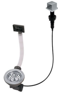
Piletta automatica LIRA 8407 103