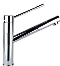
Miscelatore Lorenzo 8466 000