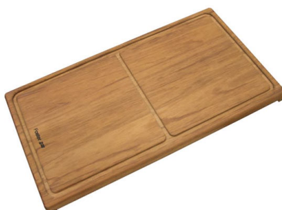
Tagliere scorrevole in legno Iroko 8643 000